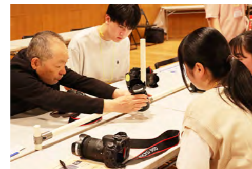
講師からのカメラレクチャー これで使い方はバッチリ！