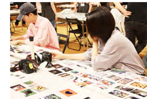
写真を厳選して写真集制作 写真の組み方をじっくり考えよう！