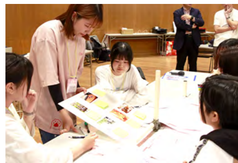
大学生を交えたグループでミニゲーム どんな意見が出るかな？