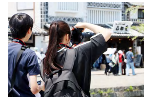
倉敷美観地区で撮影 絵になるモチーフばかり