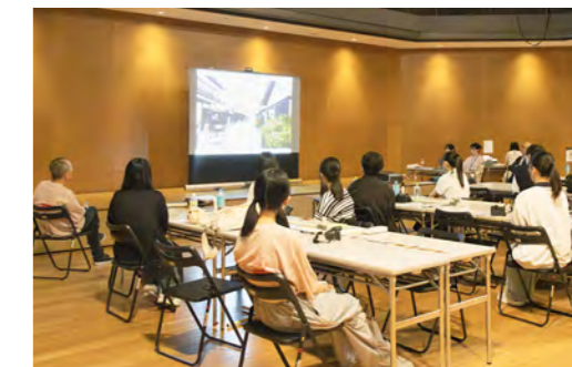
ドキドキの講評！ 学べることたくさん！